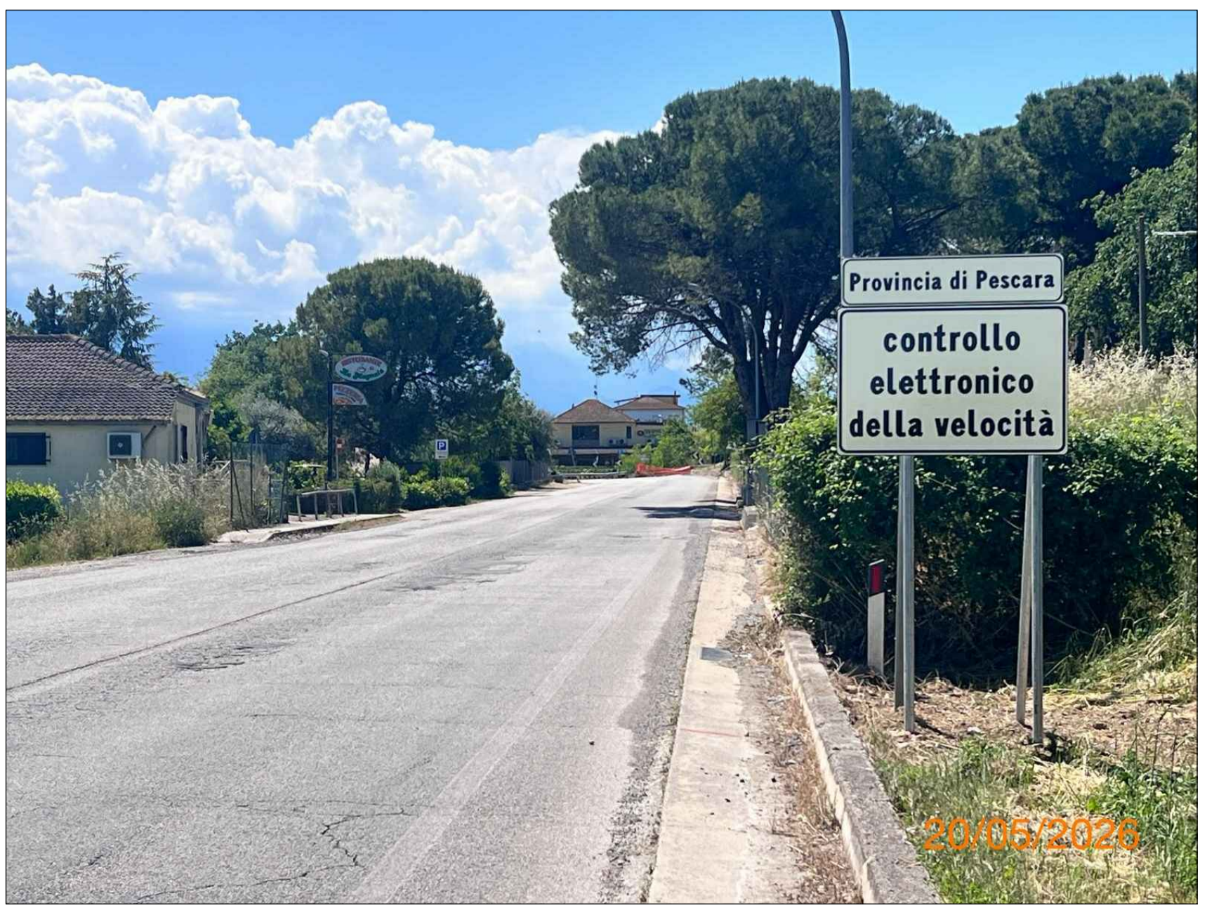
Segnaletica di preavviso a 150 m dalla Postazione dir. Teramo