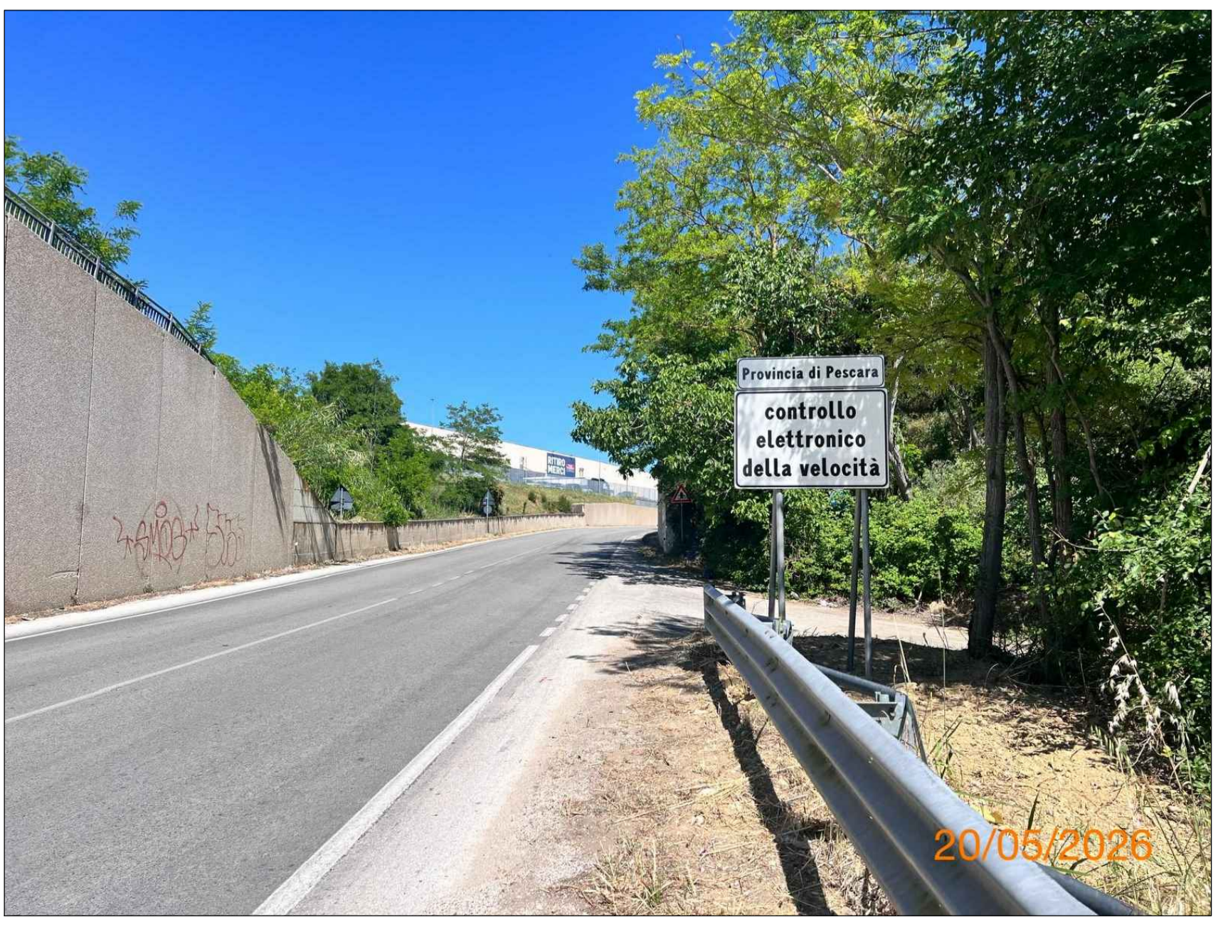
Segnaletica di preavviso a 175 m dalla Postazione dir. Pescara