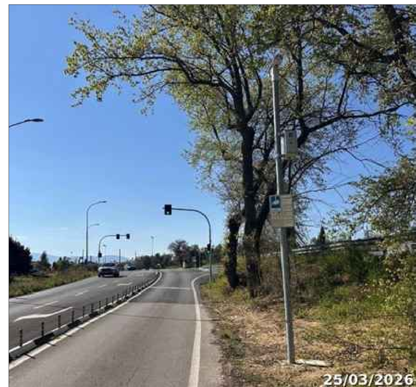
TLC1 - Viale S.Vincenzo dir.Ovest