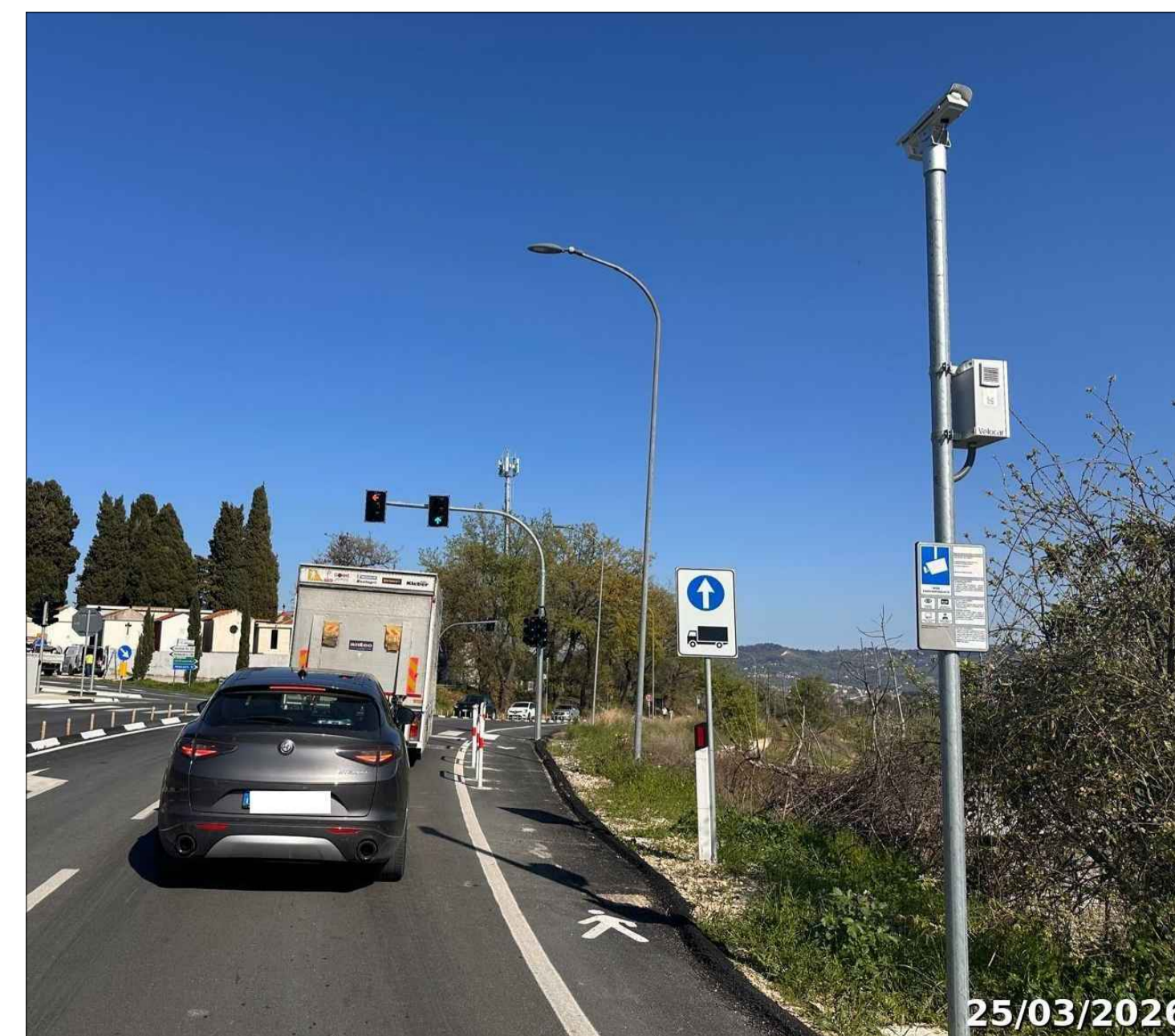
TLC2 - Contrada Vicenne Sud dir.Est